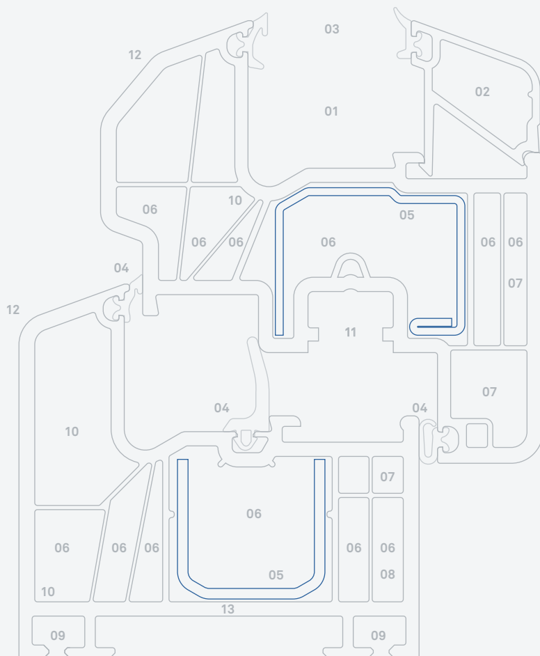
Prestige nadčasový I 76.6 C4 so stredovým tesnením (MD)

Rámové a krídlové profily sa dodávajú v rôznych výškach.